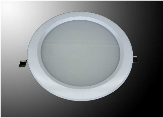
SMD LED Down Light