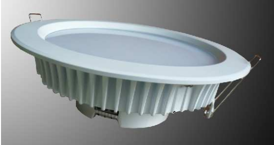
SMD LED Down Light