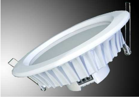
SMD LED Down Light