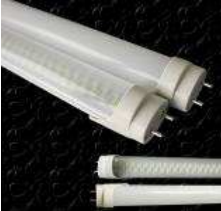
Tubo T8 LED